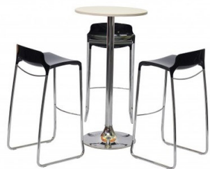
PACK MOBILIER #1 1 mange debout et 2 tabourets Tarif HT : 180 € HT Quantité : ...