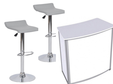
PACK MOBILIER #4 1 banque d'accueil et 2 tabourets Tarif HT : 250 € HT Quantité : ...