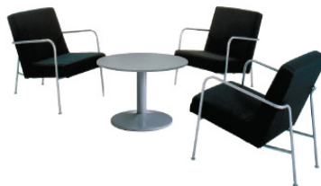
PACK MOBILIER #3 1 table basse et 2 chauffeuses Tarif HT : 200 € HT Quantité : ...