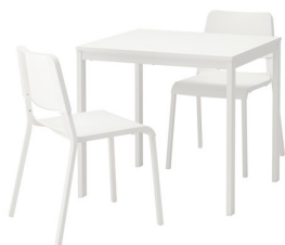
PACK MOBILIER #2 1 table et 2 chaises Tarif HT : 50 € HT Quantité : ...